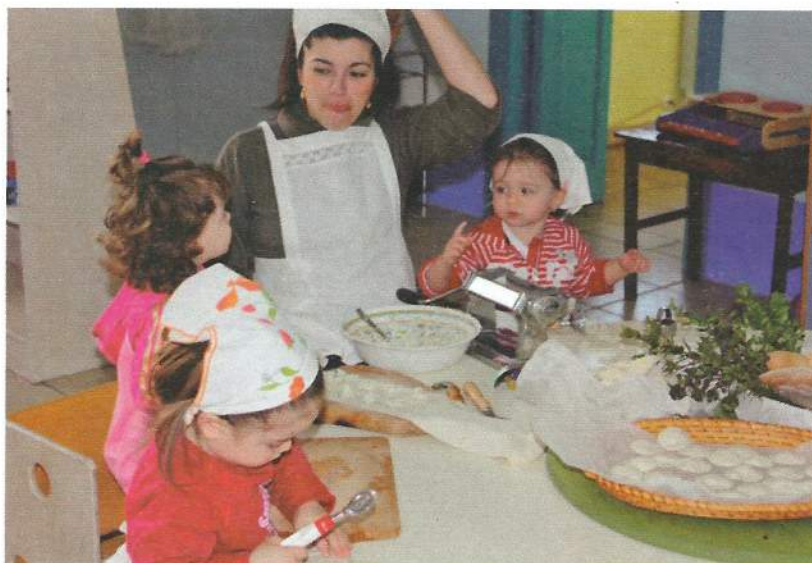
Eco-nido Abbamama (Oristano). Sopra: corso di cucina. Sotto: insieme ad annaffiare l'orto.